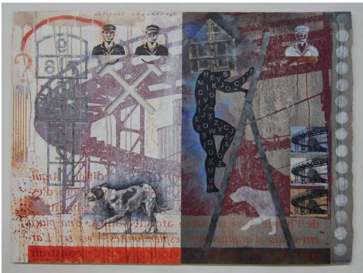
National Geographic 2005/2009

En aquesta obra hi reconeixem els trets més significatius i recurrents de l'obra de Quim Domene: l'ús de la seva particular iconografia d'objectes, la juxtaposició d'imatges que proposen narracions inconnexes i oníriques, la cura especial en el disseny, la composició i els detalls i l'ús de material literari i poètic. De totes maneres, fent referència a aquest últim aspecte, aquesta és la primera vegada que el llibre, com a objecte, es converteix en l'obra artística en si mateixa, fruit de la constant investigació i el treball en diversos materials i producte de l'ús, cada cop més omnipresent en la seva obra, de la memòria com a espai creatiu.