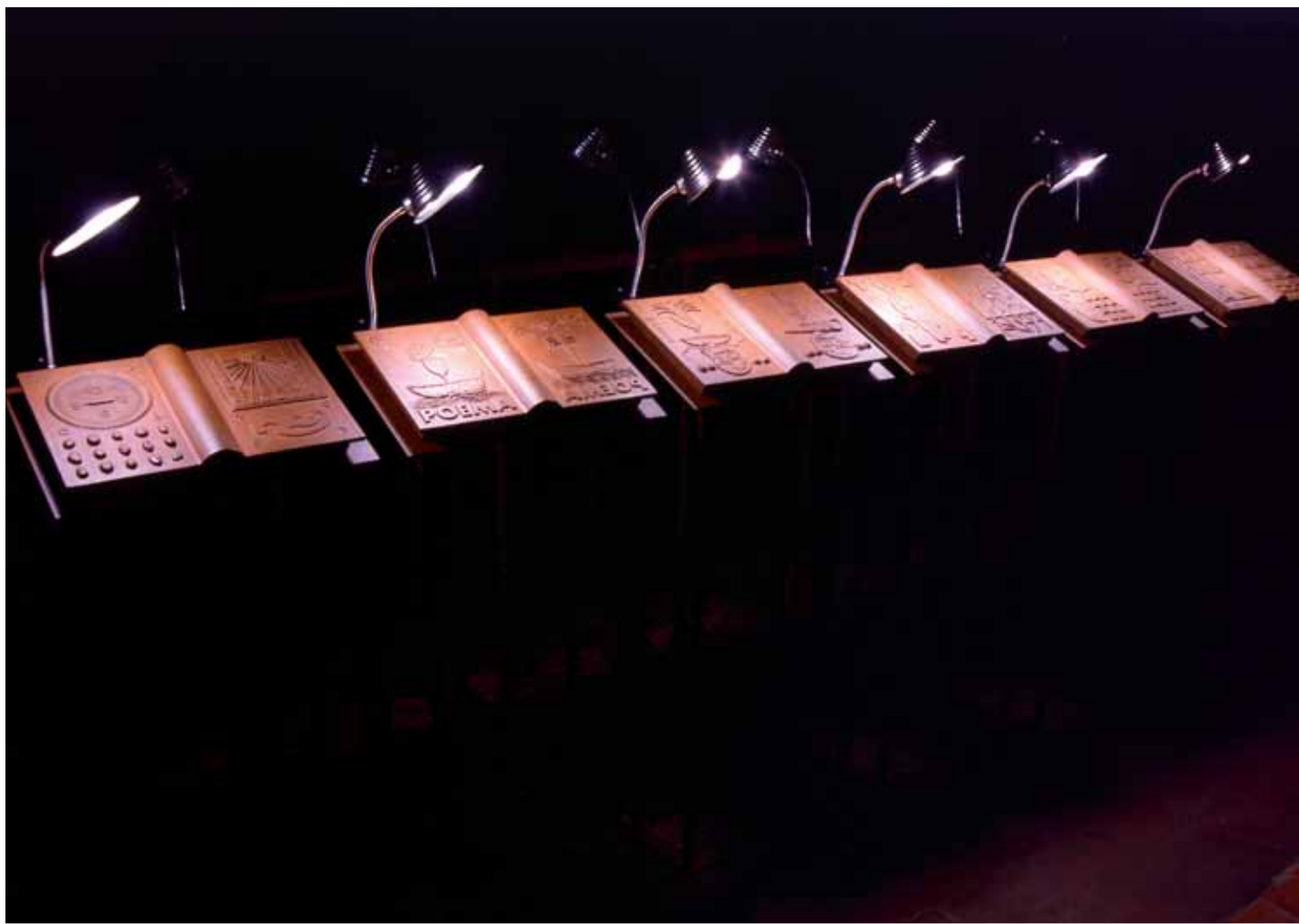
Fem llum al magatzem dels llibres. Poemes de J.V.Foix 2002